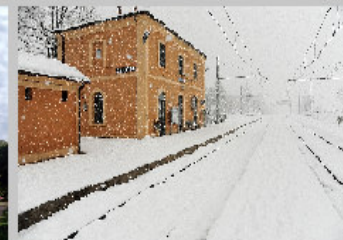
2° classificato con 258 voti foto n° 9 Titolo: "Castenaso insolita" di Maurizio Bortolotti