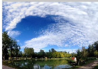
1 a classificata con 328 voti la foto n° 5 Titolo: "Laghetto della 'Madonna' o del Paradiso" di Isabella Franchini

Nel corso della Festa dell'Uva, edizione 2014 la giuria popolare ha premiato i partecipanti al concorso I Love Castnes, organizzato dal Gruppo Fotografico La Rocca: