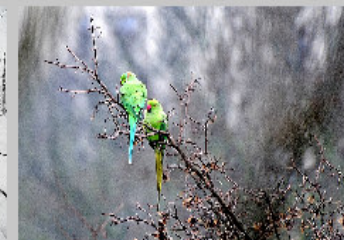
3° classificato con 238 voti foto n° 8 Titolo: "Anche noi abbiamo scelto di vivere a Castenaso" di Mauro Malaguti

Complimenti ai nostri soci Isabella, Maurizio e Mauro che con le loro immagini a tema "I love Castnes" si sono meritati un bello spazio in copertina ed all'interno del periodico comunale Castrum Nasicae nr. 6 - dicembre 2014! Bravi!