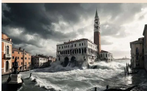
▲ "Paesaggi paralleli" di Maurizio Grandi

Al Photolux Festival di Lucca primo concorso dedicato all'AI nella fotografia, ma i vincitori mettono in chiaro che si tratta di una forma d'arte differente, con un proprio potenziale espressivo. Che non può nascere dall'inganno